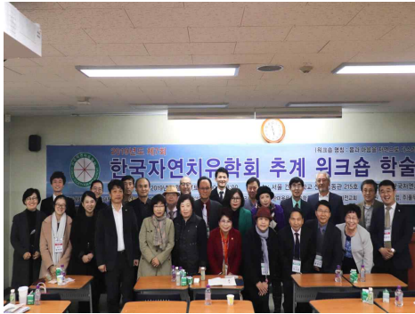
2019년 11월 워크숍 모습