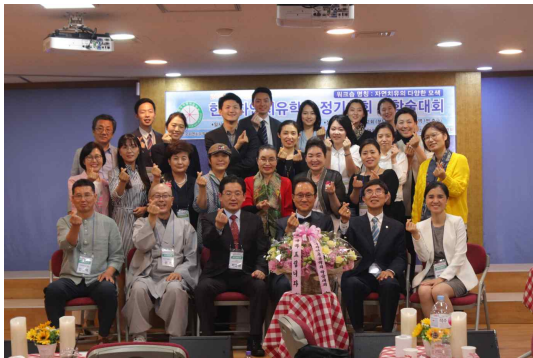
2019년 5월 총회 모습