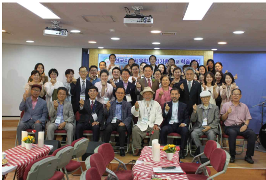
2018년 5월 총회 모습