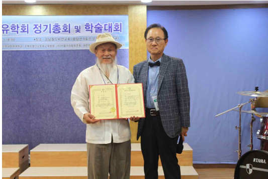
2018년 5월 총회 모습