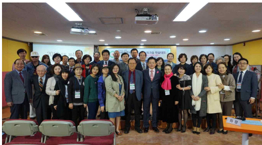
2016년도 워크숍 모습