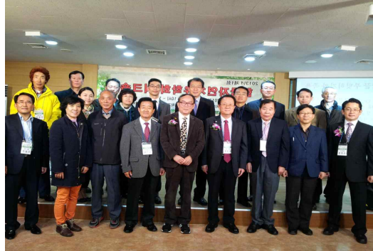
2013년도 워크숍 모습