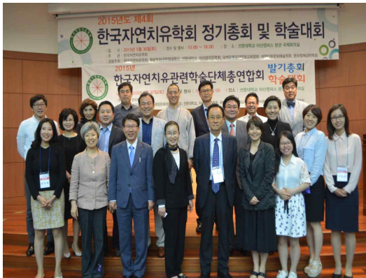
2015년도 총회 모습