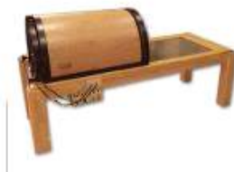
오카니와 추리산 돌침대