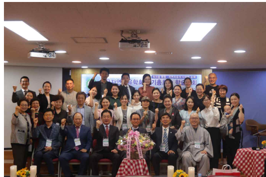
2019년 5월 총회 모습