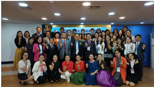
2017년도 5월 총회 모습