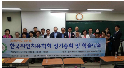
2016년도 5월 총회 모습