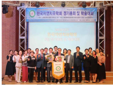
2020년 5월 정기총회 모습