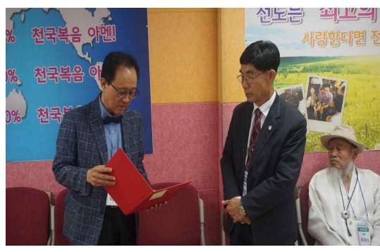
2018년 5월 총회 모습