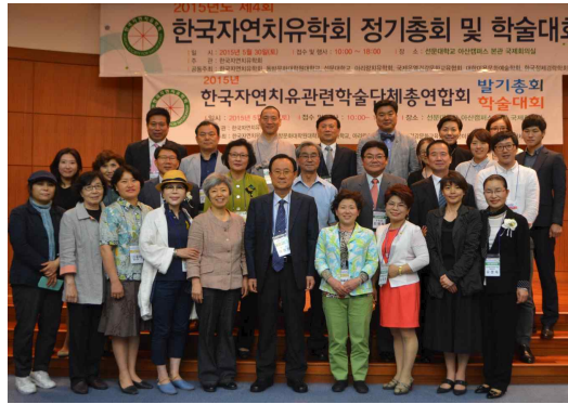
2015년도 총회 모습