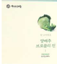
양배추-브로콜리 진의 상표와 상품

“양배추 브로콜리 진”이 높게 평가받는 이유”열에 약한 양배추를 팔팔 끓여 즙으로 만드 는 1차원적인 증탕 제조 방식에서 완전히 벗어난, 차별화된 저온숙성 제조공법을 개발해 양배추 원액을 진하게 추출하여 재 숙성하여 맛을 냈다.