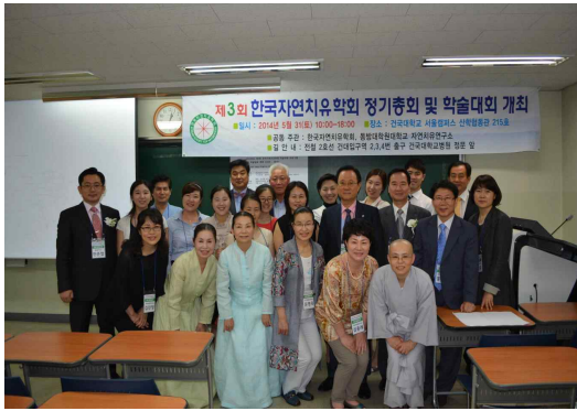
2014년도 총회 모습