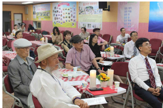
2018년 5월 총회 모습