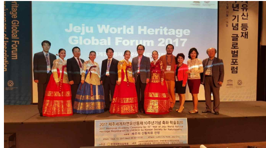
2017년도 9월 제주도Workshop 모습